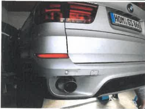
Stoßfänger hinten gebrochen/Kratzer