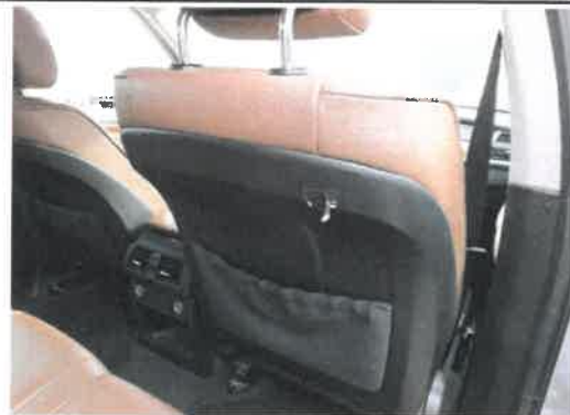
Sitzbezug Beifahreritzz gerissen