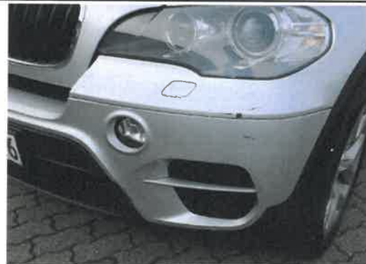
Stoßfänger vorne Kratzer/gebrochen